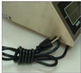
Incluye cable de uso rudo para conectar a corriente eléctrica