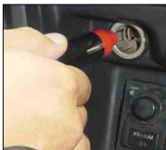
Adaptador para automóvil.